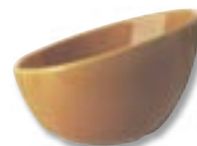
Miska Soare – kamionka, średnica 18 cm, 19,99 zł, IKEA.