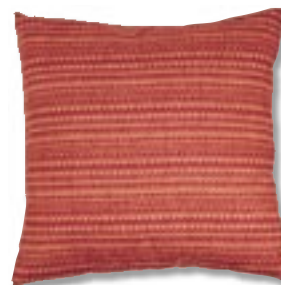
Poduszka – bawełna, 42 x 42 cm, 48,90 zł, Cafe Decor.