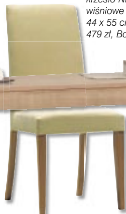
krzesło Nicole – drewno wiśniowe i tkanina, 44 x 55 cm, wysokość 96 cm, 479 zł, Bo Concept.