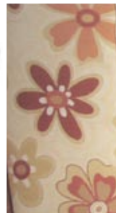
Tkanina z kolekcji Fashion – bawełna i polyester, szerokość 140 cm, cena sugerowana 40 zł/m.b., Dekoraria.