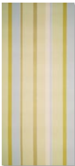
Tapeta winylowa Radzio – szerokość 50 cm, długość 10 m, 54,90 zł/rolka, Leroy Merlin.