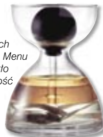
Karafka do przypraw płynnych z kropłomierzem Menu – dmuchane szkło i guma, pojemność 300 ml, 99 zł, Fide.