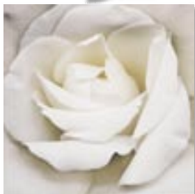
Obraz Pjatteryd – fotonadruk na płótnie, 56 x 56 cm, 129,95 zł, IKEA.

W prezentowanym wnętrzu zastosowałam kolor zielony, jasne odcienie niebieskiego, delikatny żółty, kremowy. Podłoga i meble są z naturalnego dębu. Kolor jasnoniebieski daje poczucie czystości, jasności, świeżości. Działa uspokajająco, niesie odprężenie, poczucie zadowolenia i wewnętrznej harmonii. Zieleń jest miła dla oka, pogodna i bliska naturze. Działa uspokajająco, wzmacniająco i relaksująco a w odcieniu żółtawym – łagodnie pobudza. Oba kolory w jasnych odcieniach powiększają optycznie przestrzeń.