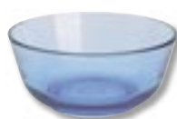
Miska Syntes Glas – szkło, średnica 14 cm, 5,99 zł, IKEA.