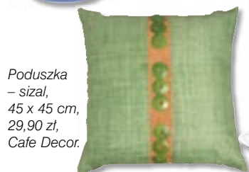
Poduszka – szał, 45 x 45 cm, 29,90 zł, Cafe Decor.