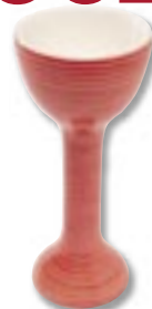
Kieliszek na jajko Egg'n Breakfast – ceramika, wysokość 15,5 cm, 16 zł, Fide.pl