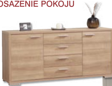
Komoda Oslo – dąb lodowy, 39,5 x 160,8 cm, wysokość 72,9 cm, 459 zł, Forte.