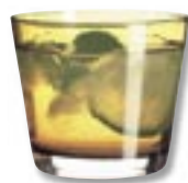
Szklanka Diod – szkło, wysokość 8 cm, 5,99 zł, IKEA.