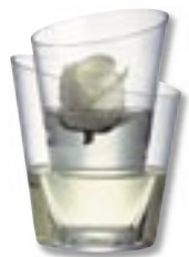
Wazon Galeria – szkło, wysokość 22 cm, 162 zł, Fide.