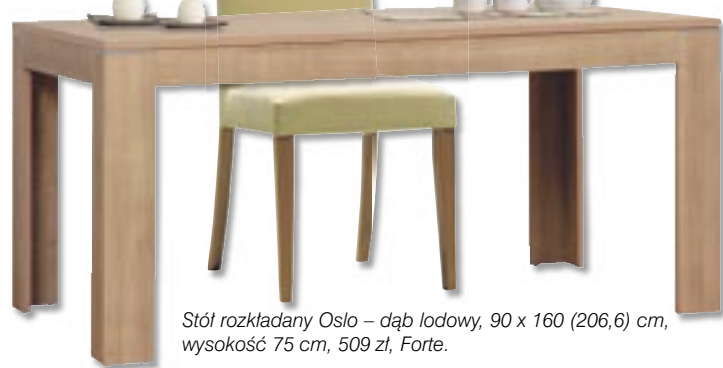
Stół rozkładany Oslo – dąb lodowy, 90 x 160 (206,6) cm, wysokość 75 cm, 509 zł, Forte.