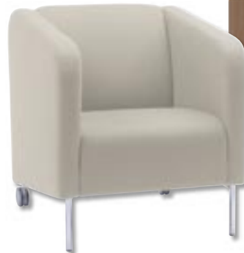
Sofa May – tkanina, 85 x 155 cm, wysokość 80 cm, 3150 zł, fotel May – tkanina, 85 x 55 cm, wysokość 80 cm, 2200 zł, podnóżek May – tkanina, 75 x 55 cm, wysokość 40 cm, 1200 zł, Com40.