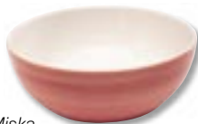
Miska – ceramika, średnica 19 cm, 29 zł, Fide.