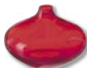
Wazon Salong – szkło, wysokość 9 cm, 9,99 zł, IKEA.